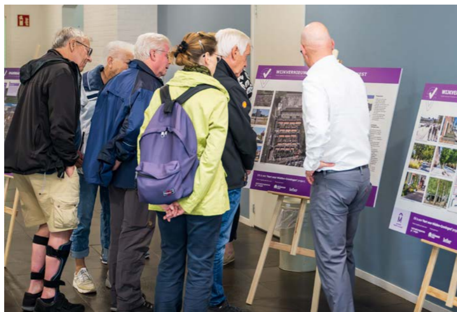
Inloopbijeenkomst was in de Agrifirm op 3 juli