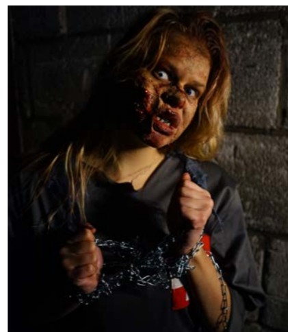
Griezelen in het spookhuis