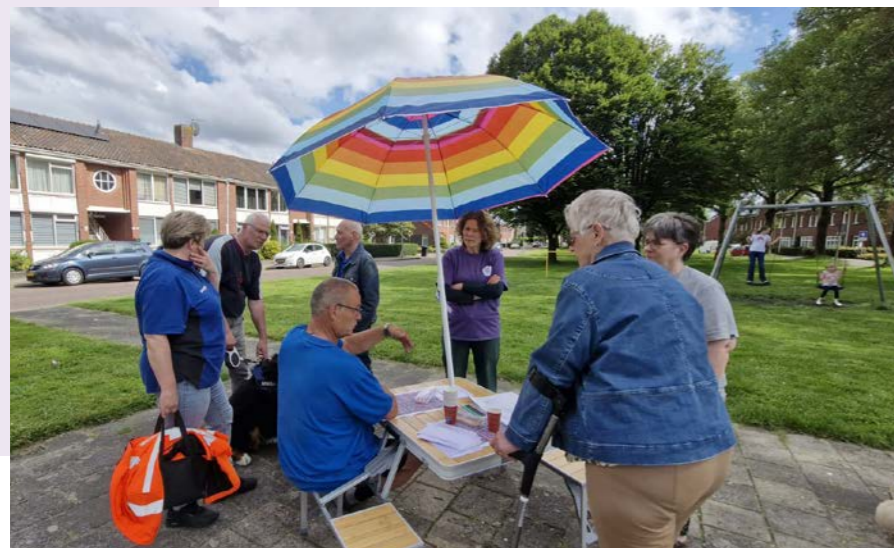
Inloopbijeenkomst juni 2024

In De Houtmanstraat willen we het gevoel van een verkeersveilige straat vergroten. In mei is een proefafsluiting voor een half jaar gestart met plantenbakken aan de westzijde van de straat. Die zijn bedoeld om het sluijverkeer door de straat te verminderen en om ervoor te zorgen dat auto's minder hard rijden.