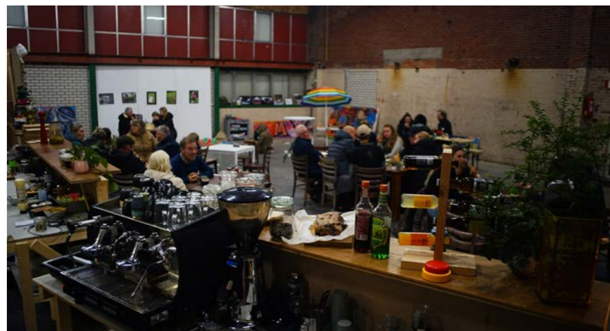
Gezelligheid in het pop-up restaurant

Op vrijdag 13 december van 16.00 tot 22.00 uur organiseren we een spannende escaperoom bij Agrifirm. De escaperoom is geschikt voor deelnemers vanaf 15 jaar of vanaf 12 jaar onder begeleiding van een volwassene. Vorm een groep van 4 of 5 personen en probeer de puzzels te kraken!