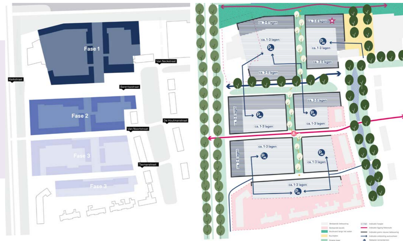
Stedenbouwkundige uitgangspunten voor Zeeheldenbuurt West.

Op de inloopavond op 3 juli zijn de plannen voor de Zeeheldenbuurt West gepresenteerd. Hier worden bijna 200 huurwoningen van Lefier en Groninger Huis gesloopt en daarvoor in de plaats komen ca. 300 nieuwe woningen terug in sociale huur en vrije sector woningen. Tegelijkertijd pakken we de openbare ruimte aan.