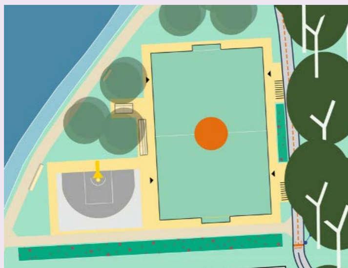
Schetsontwerp van Cruyff Court en halve basketbalveld

Bewoners reageerden enthousiast op de plannen. Er staat wat op stapel, maar eerst zien en dan geloven. Ook blijven bewoners hun zorgen uiten over de verkeersveiligheid in de wijk en is er ergernis over onderhoud van het groen. De komende jaren werkt de gemeente samen met u stapsgewijs aan maatregelen om dit te verbeteren.