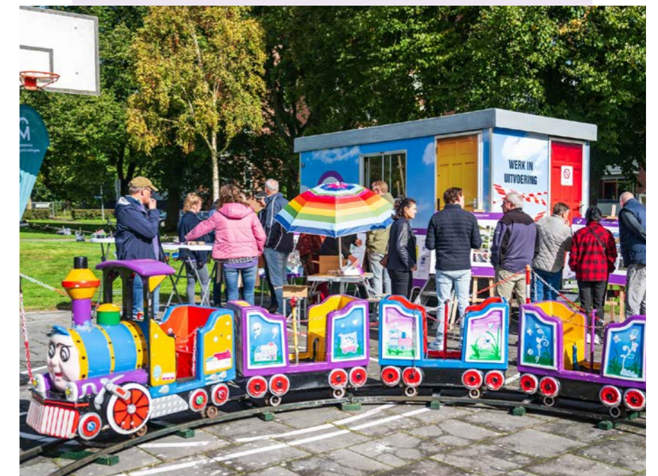
Tijdens Burendag in gesprek over wijkvernieuwing Noorderpark.

Op zaterdag 28 september was het Burendag 2024. Het was zonnig, bewolkt, regenachtig en warm en koud tegelijk. Maar los van het weer was het een mooi moment om met buurtbewoners in gesprek te gaan over de wijkvernieuwing in Hoogezand! Wat is er besproken? Suggesties over veiligheid in de wijk, vragen over de plannen en wanneer welke buurt te maken krijgt met de wijkvernieuwing, maar ook onrust of onveilige (verkeers)situaties werden gedeeld. Voor de mensen die ons kwamen opzoeken: bedankt voor jullie komst! En hopelijk tot de volgende keer.