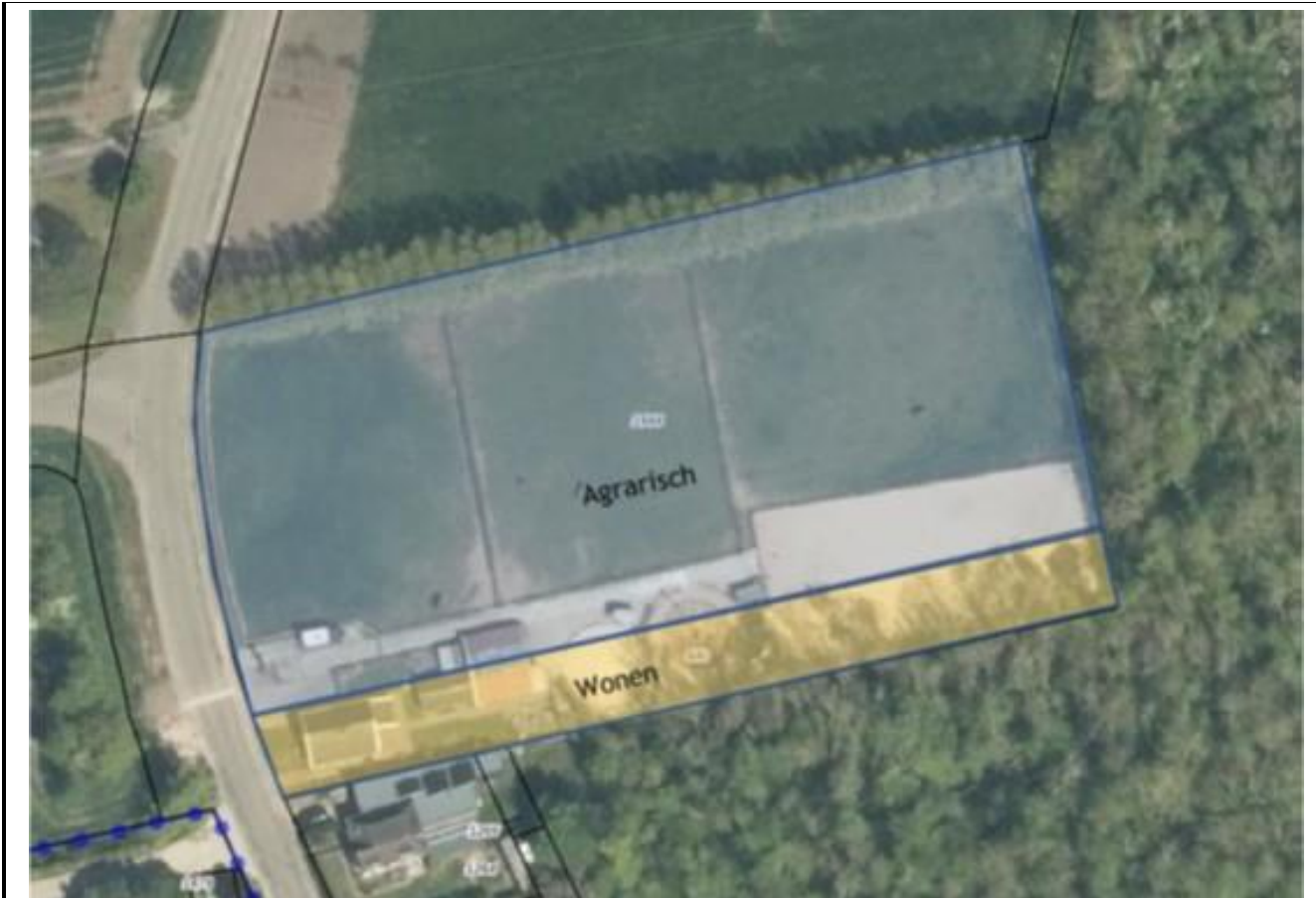
Uitsnede geldende bestemmingen uit het tijdelijke deel van het omgevingsplan