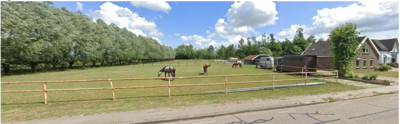
Bestaande situatie wijzigingsgebied, gezien vanaf de Noorderstraat