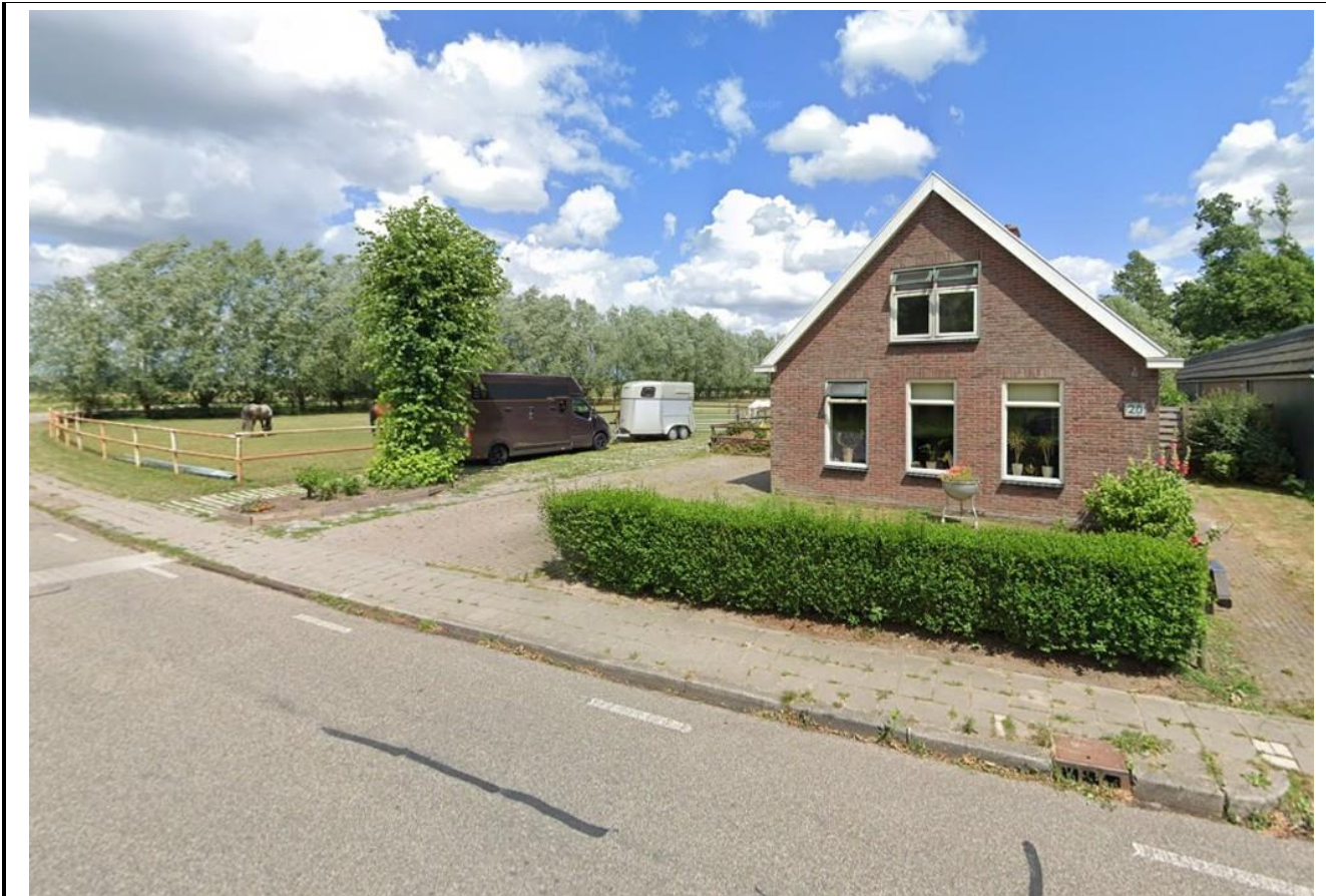
Bestaande bebouwing aan de Noorderstraat